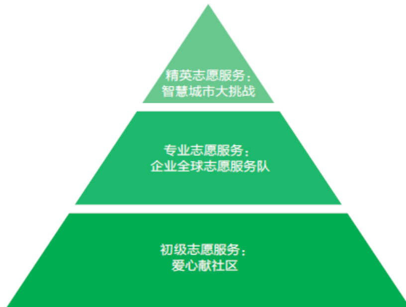
图：IBM 金字塔式的三级志愿服务体系

赠，赠与自己所服务的公益机构，平均每年捐赠约 400 万美元。另外，共有来自 52 个国家的逾 3000 名 IBM 员工参与企业全球志愿服务队项目，派往 34 个发展中国家和地区，累计完成了 1000 多个项目，覆盖人群达 16 万。超过 600 名 IBM 员工参与智慧城市大挑战项目，累计贡献服务价值超过 6000 万美元。